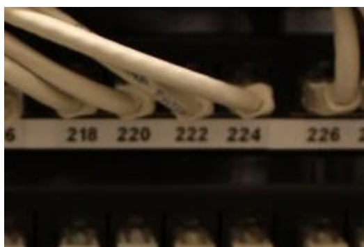
Figur 5 Merking i koplingspanel for spredenett

nnn angir samme løpenummer som på TO ved arbeidsplass.