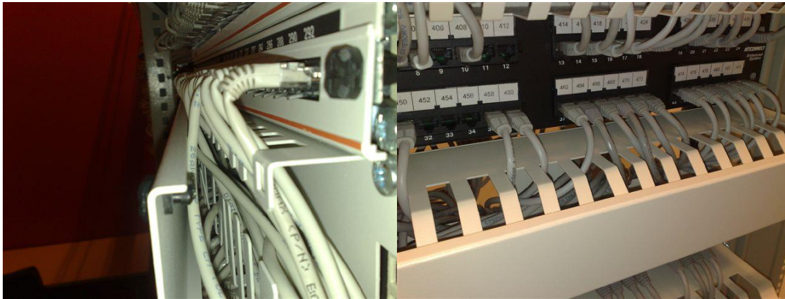
For trang kabelguide