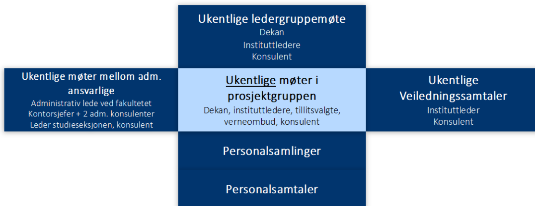
Figur 2. Møtearenaer og møtefrekvens i gjenopprettingsarbeidet inntil januar 2022

Fra våren 2022 ble ledergruppene på begge instituttene direkte involvert i gjenopprettingsarbeidet. Foruten instituttleder består disse av nestledere for henholdsvis utdanning og forskning samt programlederne for henholdsvis historie- og lektorprogrammet. Gruppen møttes i starten annenhver uke. Etter hvert ble hyppigheten redusert til tredjehver uke og nå møtes utvidet ledergruppe en gang hver måned.