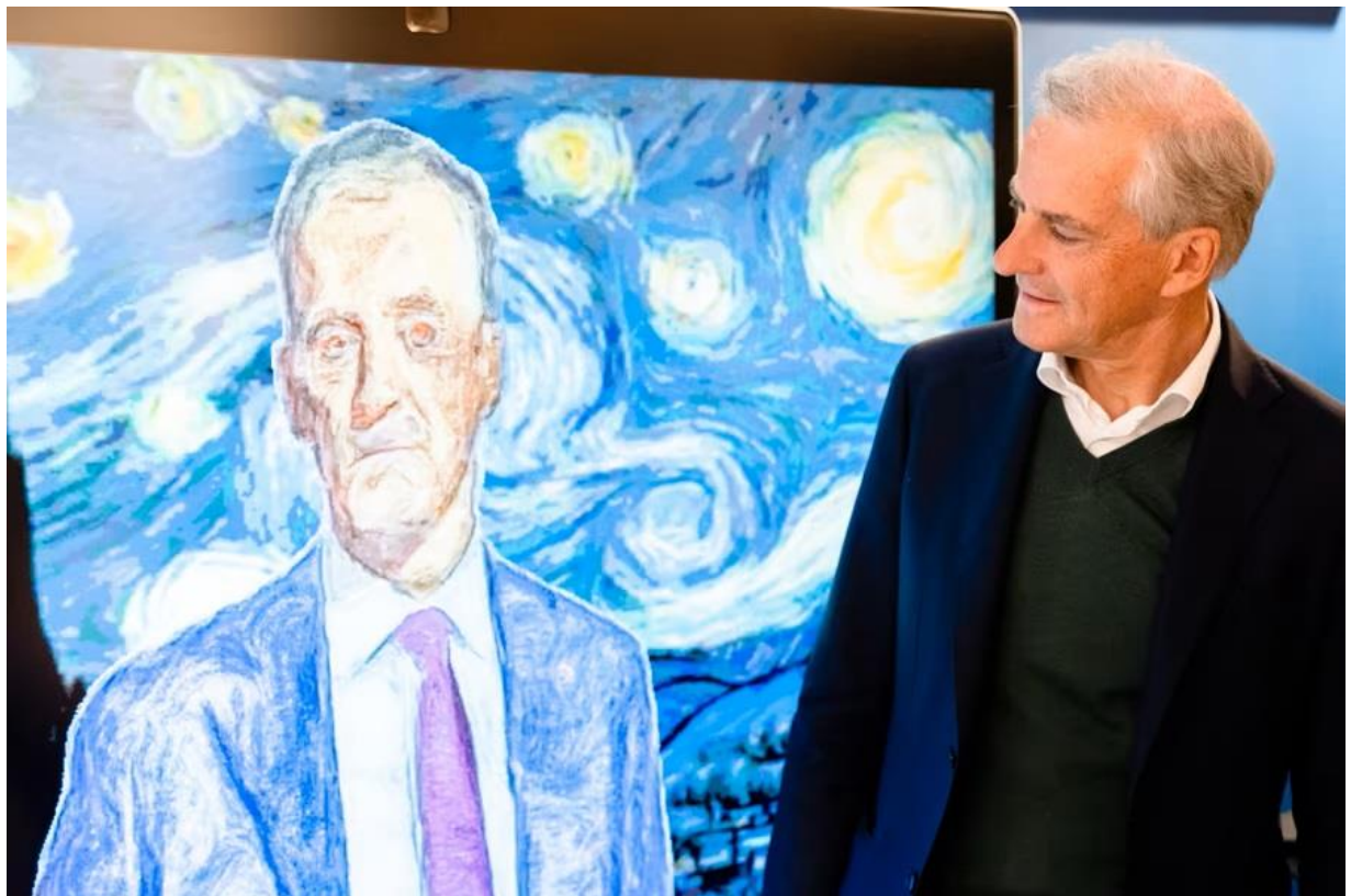
Statsminister Jonas Gahr Støre besøkte IE-fakultetet i forbindelse med lanseringen av regjeringens digitaliseringsstrategi